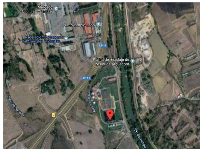
AVDA. SÁENZ DE MIERA, S/N. LEÓN-CP. 24.009- LÉON (LEÓN) https://goo.gl/maps/aQRLwb1tNX52

(imágenes obtenidas mediante capturas de pantalla del Google Maps. Se aportan Links de acceso vía web).