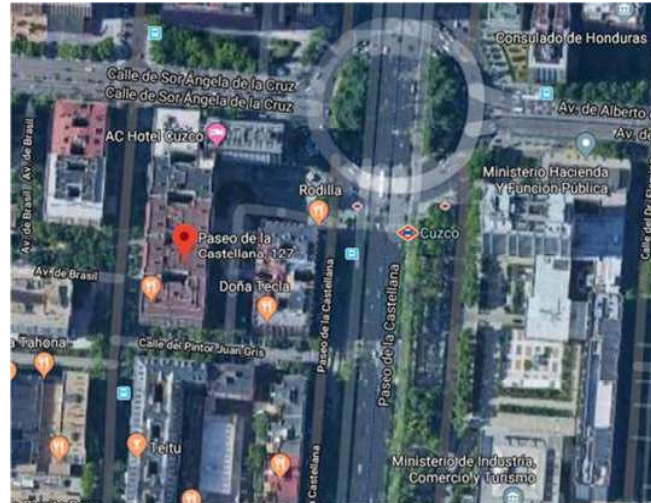
PASEO DE LA CASTELLANA, 127, 2ºB -CP. 28.46- MADRID (MADRID) https://goo.gl/maps/aJrfGX9YucR5w3cA